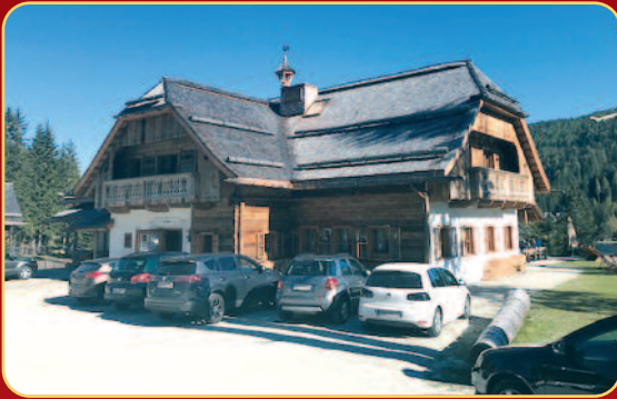
Einkehr in der Ludl-Alm während der Rückfahrt