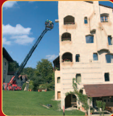
Anleiterübung Drehleiter am Objekt