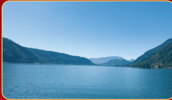
Herrlicher Blick auf den Ossiacher See