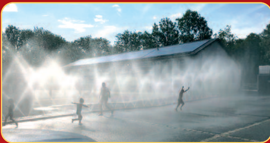
Mächtig Spaß hatten die kleinen Gäste beim Abkühlen mit dem Düsenschlauch