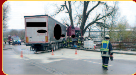
Verkehrsunfall LKW Trostberg