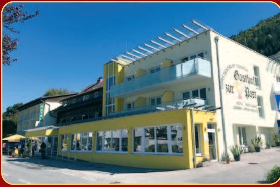
Unser Hotel am Ossiacher See