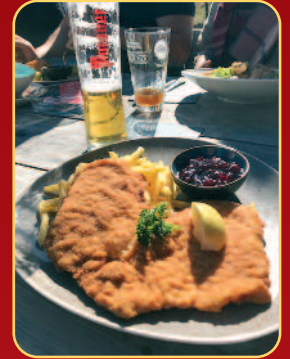
Wiener Schnitzel auf der Ludl-Alm