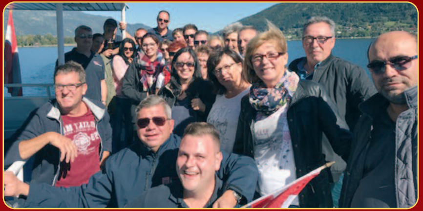
Traumhaftes Wetter konnten die Teilnehmer bei einer gemütlichen Bootsfahrt auf dem Ossiacher See genießen