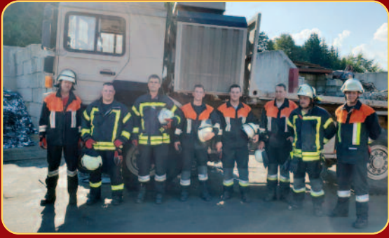
Übung Verkehrsunfall - LKW Unfall