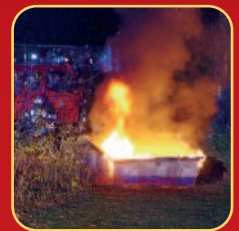
Brand eines Altpapiercontainers