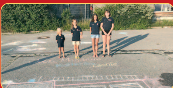
Junge Künstler ganz groß, der Feuerwehrhof wurde zur Feuerwehrkunstmeile