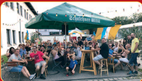
Zahlreiche Gäste mit Partner und Kinder folgten der Einladung des Vereins