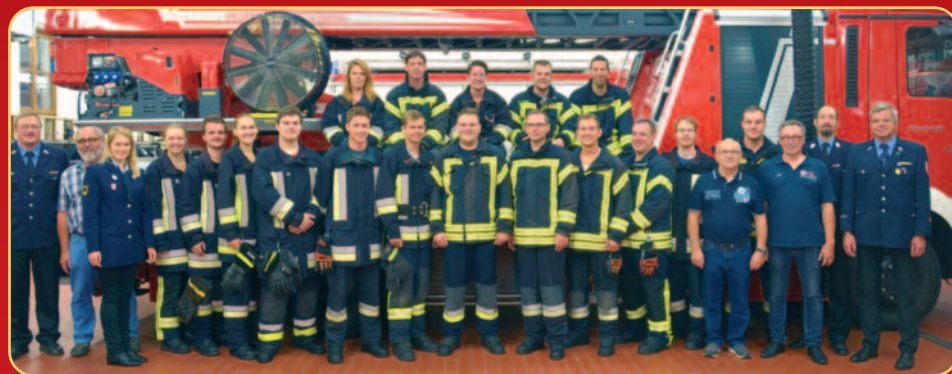
Gratulation an die Teilnehmer für den erfolgreichen Abschluss