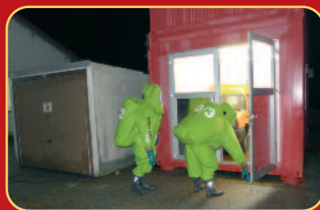
Ausbildung der Chemikalien- schutzanzugträger