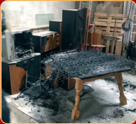
Verkohlttes Mobiliar nach einem Brand