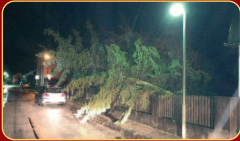
Baumgipfel über Fahrbahn Trostberg