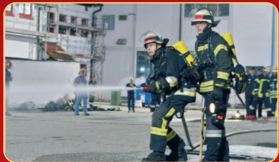
Konzentration bei der Erfüllung aller Aufgaben war angesagt