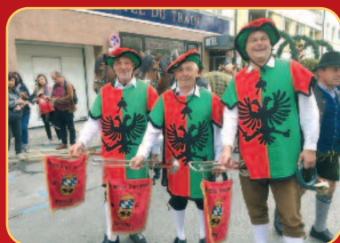
Teilnahme beim Oktoberfesteinzug 2018